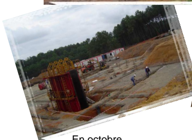
En octobre, les fondations