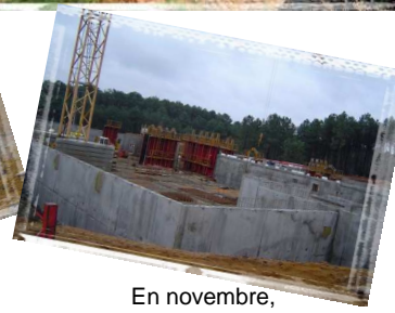
En novembre, le Rez de Chaussée bas prend forme