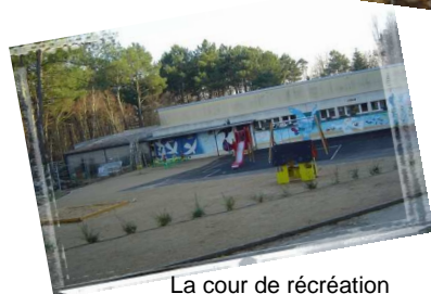
La cour de récréation

En septembre, les premiers terrassements avec en arrière plan la nouvelle clinique du Terre Rouge