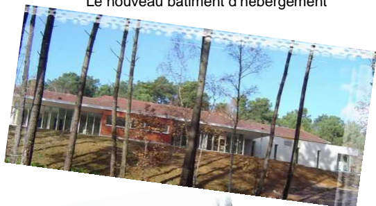
Le nouveau bâtiment d'hébergement