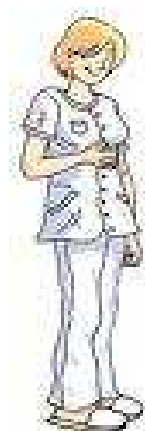
Des professionnels de santé au service des populations locales